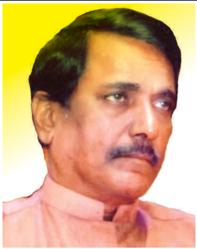
බන්දුල පී දයාරත්න ජ්‍යෙෂ්ඨ අධ්‍යාපනවේදී, අධ්‍යාපනපති