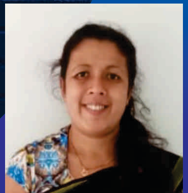
ගයා කුමාරි ප්‍රාදේශීය ලේකම් කාර්යාලය වැලිගොපොල