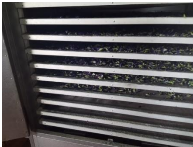
මල් වියළන විජලන යන්ත්‍රය

නිර්මාණය කරන ව්‍යාපාරයකි. අමු කටරොළ මල් වෙනත් පාර්ශවයන්ගෙන් මිලදී ගෙන වියලා Tea bag, කටරොළ පවුඩර්, නිල් කටරොළ තේ කුඩු සකස් කර දෙස් විදෙස් රටවලට අපනයනය කරයි . අමු මල් 1 Kg ක් රුපියල් 200 ත් 250 ත් අතර මිලකට මිලදී ගනී. අමු මල් 1 Kg ක් සඳහා මල් 1000 ත් 1200 ත් අතර ප්‍රමාණයක් අඩංගු වේ.වියළි මල් 1 Kg ක් රුපියල් 2500 ක මුදලකට මිලදී ගනු ලැබේ. මල් වියළීම සඳහා “ සහිරු” ආයතනයෙන් රුපියල් 20000 සිට මැණිත් මිලදී ගත හැකිය. දිනුක් ලංකා නිෂ්පාදන (DINUK LANKA PRODUCT ) ලෙස වෙළඳපොළට පැමිණෙන මෙම නිෂ්පාදන ආයතනයේ සත් රැකියා 10 ක් පවතින අතර වක්‍ර රැකියා බොහෝමයක් නිර්මාණය වී ඇත. වක්‍ර රැකියා අතර වගාකරුවන්, ප්‍රවාහනකරුවන් සහ අතරමැදියන් ප්‍රධාන වේ. මෙම නිෂ්පාදන සඳහා දේශීය වෙළඳපොළට වඩා විදේශීය වෙළඳපොළ ප්‍රමුඛස්ථානයක් ගනී. ඇමරිකාව, එංගලන්තය, ප්‍රංශය සහ ඊශ්‍රාලය යන රටවල් වෙත වෙනත් වෙළඳ නාමයකින් නිෂ්පාදන අපනයනය කරනු ලැබේ.ඉහත රටවල් වෙත තමන්ගේ නමින් නිෂ්පාදන අපනයනය කිරීමට තත්ව සහතිකයක් ලබා ගැනීමට නොහැකි වී ඇත.