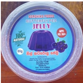
නිල් කටරොළ ජෙලි

2019 වර්ෂයේ ආරම්භ කරන ලද මෙම නිෂ්පාදන ව්‍යාපාරය දේශීය වෙළඳපොළ ඉලක්ක කර ගනිමින් සකස් කරනු ලැබේ. නිල් කටරොළ වයින්, ජෙලි, Tea bag නිෂ්පාදන ලෙස සකස් කරනු ලැබේ. නිල් කටරොළ වයින් සඳහා විදේශ සංචාරකයින්ගේ විශාල ඉල්ලුමක් පවතින නමුත් ඒ සඳහා ජාතික හා ජාත්‍යන්තර තත්ව සහතිකයක් නොලැබීම නිසා වෙළඳපොළට සැපයිය නොහැකිව ඇත. වගා කරන ලද කටරොළ ප්‍රමාණවත් නොවන නිසා වෙනත් පාර්ශවයන්ගෙන් අමු මල් 1 Kg ක් රුපියල් 200 ත් 250 ත් අතර මිලකට මිලදී ගෙන විපලන යන්ත්‍ර භාවිතයෙන් වියළා ගනු ලැබේ. කටරොළ වැල් 25- 50 ත් අතර ප්‍රමාණයකින් අමු මල් 1 Kg ක් නෙලා ගත හැකිය. මේ සඳහා විශේෂ පොහොරක් භාවිතා නොකරන අතර ගිනිසිඬියා කොළ වියළා යොදනු ලැබේ.