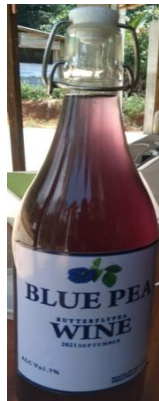
නිල් කටරොළ වයින්