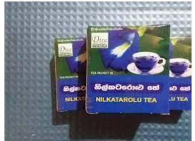
නිල් කටරොළ තේ