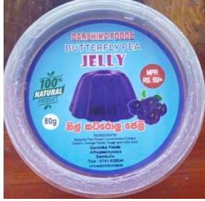
නිල් කටරොළු ජෙලි