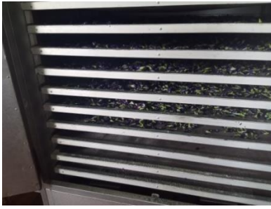
මල් වියළන විෂලන යන්ත්‍රය