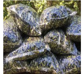
කරන ලද මල්