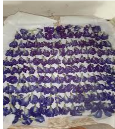
වියළීමට සකස් කරන ලද මල්