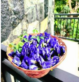
නෙලා ගන්නා ලද මල්