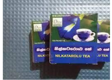
නිල් කටරොළු තේ