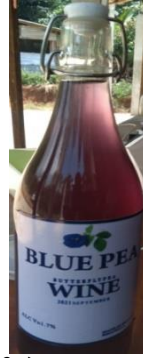
නිල් කටරොළු වයින